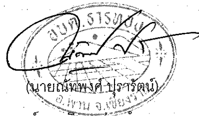
นายกองค์การบริหารส่วนตำบลธารทอง