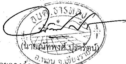
นายกองค์การบริหารส่วนตำบลธารทอง